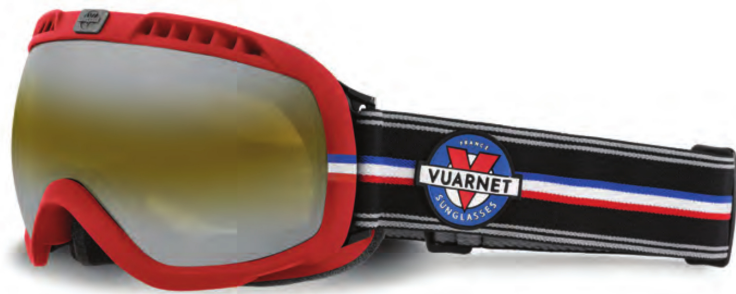
VUARNET Modèle : VK11010017. Coloris : variations. autour des couleurs de la marque (bleu, blanc, rouge). DISTRIBUTION : SPORTOPTIC POUILLOUX