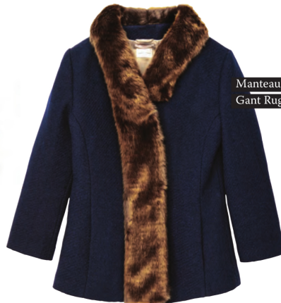
Manteau Gant Rugger