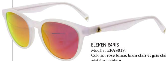
ELEVEN PARIS Modèle : EPAS018. Coloris : rose foncé, brun clair et gris clair. Matière : acétate. DISTRIBUTION : OPAL

DEMETZ Modèle : Glory. Coloris : blanc, gris, bleu et mauve. Matière : double écran en polycarbonate. DISTRIBUTION : DEMETZ OPTIQUE SPORT