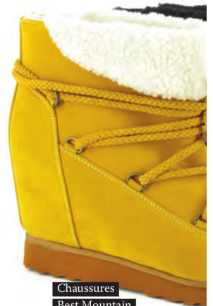
Chaussures Best Mountain

Qui dit week-end au ski, dit protection solaire. Tout dépend ensuite de l'activité de chacun sur les sommets enneigés. Pour les plus sportifs, l'élément indispensable reste le masque de ski. Et chaque saison, les fabricants d'équipements repoussent les limites technologiques pour offrir des masques toujours plus performants. Pour les ballades en station, on préférera des lunettes de soleil stylées aux accents montagnards ou d'un blanc immaculé.