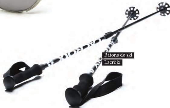
Batons de ski Lacroix