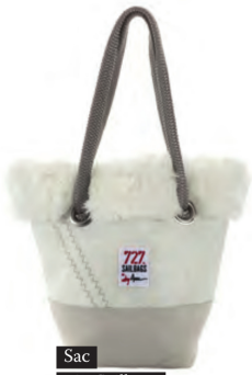
Sac 727 Sailbags