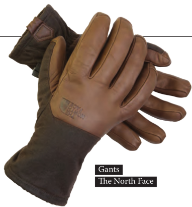
Gants The North Face

LOUBSOL Modèle : Chrono. Coloris : noir/blanc ; blanc/orange ; noir/orange ; noir et avec 5 écrans différents : fumé MC bleu, fumé MI argent, fumé MC orange, orange photochromique, orange standard. DISTRIBUTION : LOUBSOL