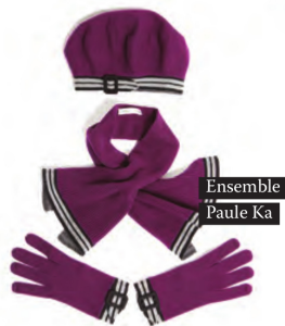
Ensemble Paule Ka