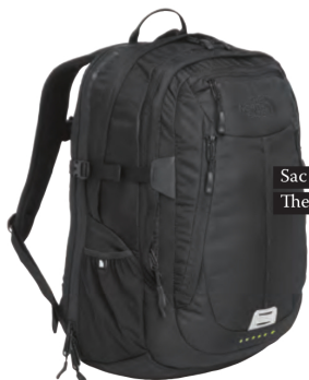
Sac The North Face