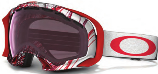
OAKLEY Modèle : Splice. Coloris : 5 combinaisons de couleurs disponibles. DISTRIBUTION : OAKLEY