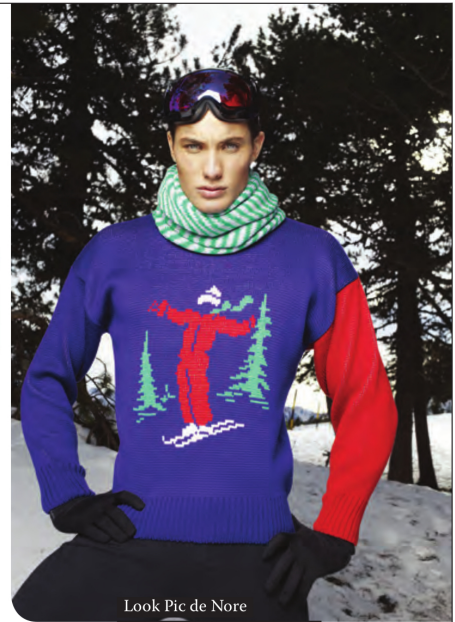
Look Pic de Nore Automne-Hiver 2014-2015