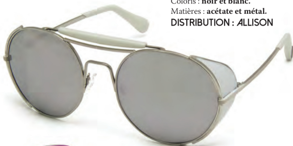
ILLI OPTICS Modèle : WA508S04. Coloris : noir et blanc. Matières : acétate et métal. DISTRIBUTION : ALLISON