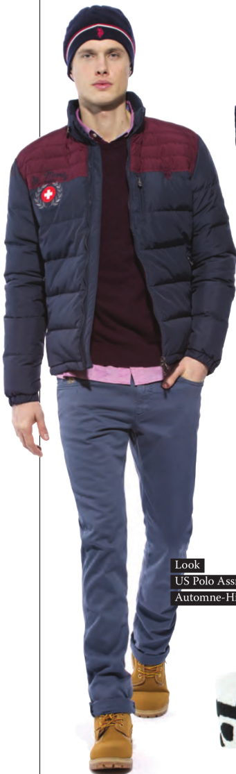
Look US Polo Assn Automne-Hiver 2014-2015