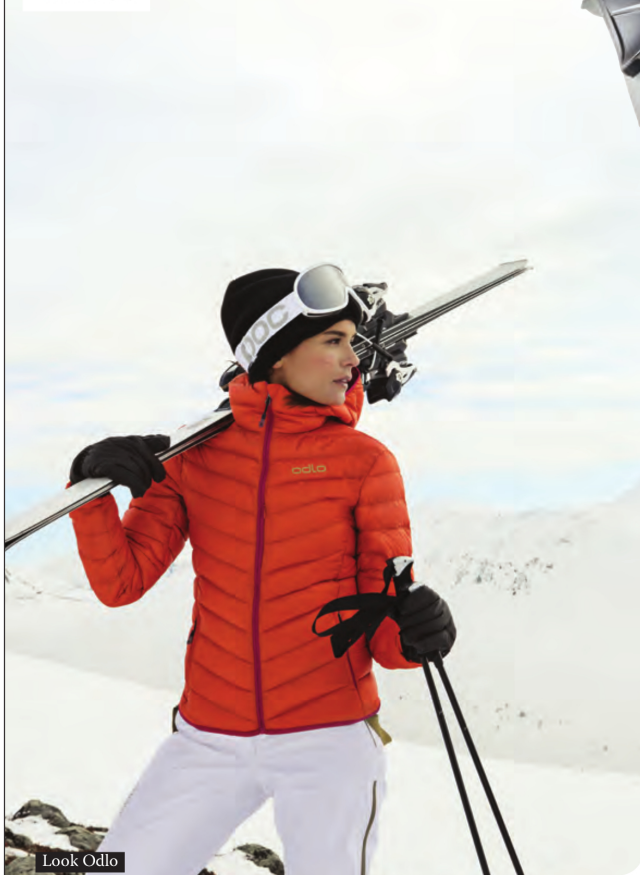
Look Odlo Automne-Hiver 2014-2015