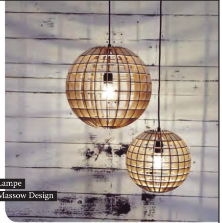
Lampe Massow Design

PRESTIGE Modèle : P1580. Coloris : présenté ici en coloris 37 (rouge, fuchsia et prune). Matière : inox. DISTRIBUTION : VUILLET VEGA