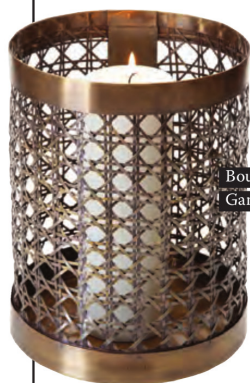
Bougie Gant Home