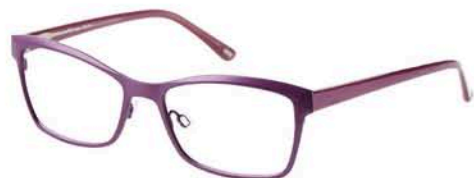
INFACE Modèle IF 1171. Matière titane. Distribution : ALFA EYEWEAR