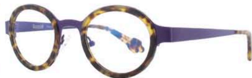
FREAKSHOW Modèle Capone. Coloris 3 coloris disponibles. Matières acétate et métal. Distribution : ANGELEYES