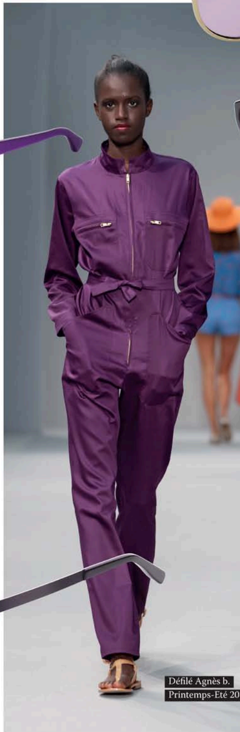
Défilé Agnès b. Printemps-Eté 2014