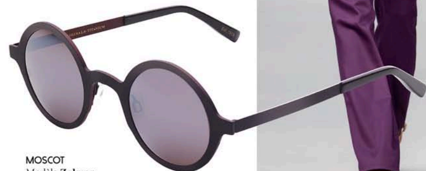
MOSCOT Modèle Zolman. Coloris 3 coloris proposés. Matière acétate. Distribution : BAUM/VISION