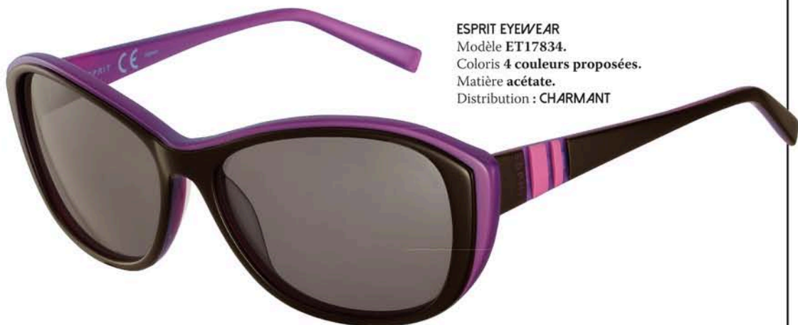
ESPRIT EYEWEAR Modèle ET17834. Coloris 4 couleurs proposées. Matière acétate. Distribution : CHARMANT