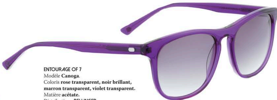
ENTOURAGE OF 7 Modèle Canoga. Coloris rose transparent, noir brillant, marron transparent, violet transparent. Matière acétate. Distribution : BELLINGER