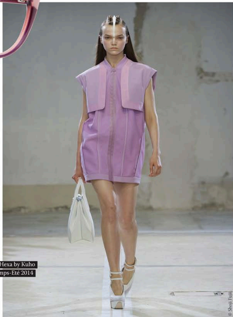
Défilé Hexa by Kuho Printemps-Eté 2014