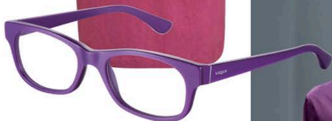
VOGUE EYEWEAR Modèle VO 2837. Coloris écaille, bleu, rouge, noir, violet. Matière acétate. Distribution : LUXOTTICA