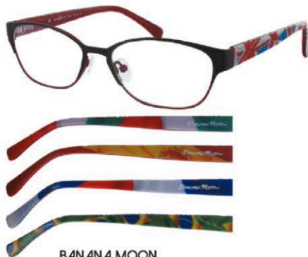
BANANA MOON Modèle White Palm. Coloris 300 combinaisons disponibles. Matières inox et acétate. Distribution : VISIOPTIS