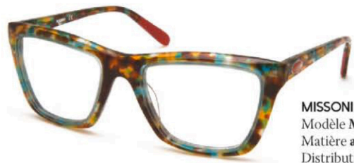
MISSONI Modèle MI303V03. Matière acétate. Distribution : ALLISON

COUPE DU MONDE OBLIGE, c'est une vague brésilienne qui envahit la mode en ce printemps-été 2014. Et ne croyez pas que ce raz de marée tropical ne concerne que le vestiaire masculin. Les femmes aussi ont droit à leur touche de samba pour célébrer la plus grande manifestation de football au monde.