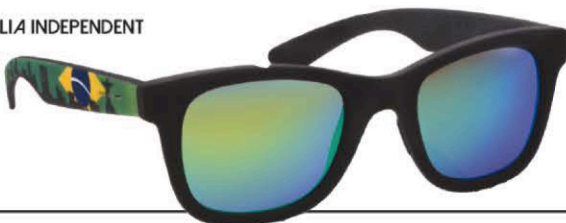
ITALIA INDEPENDENT Modèle 090 World Cup. Coloris 8 imprimés pour les branches et 3 couleurs de verres. Matière acétate. Distribution : ITALIA INDEPENDENT