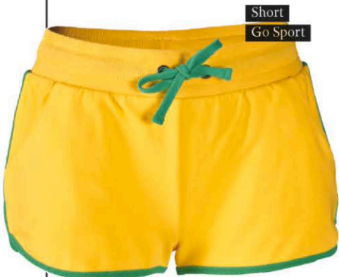
Short Go Sport