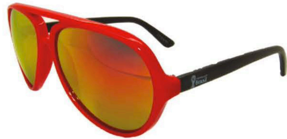
FIFA WOLD CUP 2014 Modèle 1236. Coloris 3 coloris proposés. Matière acétate. Distribution : CA VA SE VOIR