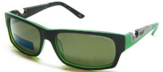
RIP CURL Modèle VSA972 - Moledo. Coloris 3 coloris proposés. Matière acétate et métal. Distribution : ADCL APLUS