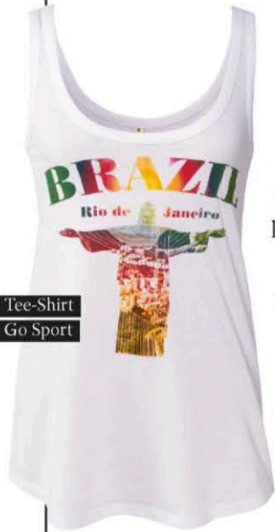
Tee-Shirt Go Sport

Mêmes pistes en lunetterie. Si ce sont principalement les lignes solaires qui se mettent aux couleurs du Brésil, certains fabricants n'ont pas oublié les amétropes qui soutiendront fièrement leurs équipes préférées, à l'image de Banana Moon qui propose des lunettes avec des branches interchangeable pour affirmer ses préférences. A côté de la gamme de lunettes officielles de la Coupe du Monde, de nombreux créateurs ont choisi des tonalités de vert, seules ou agrémentées d'imprimés palmiers. Pour les amateurs de bière durant les matchs, il y a même une solaire avec décapsuleur intégré dans la branche. Que demander de plus ?