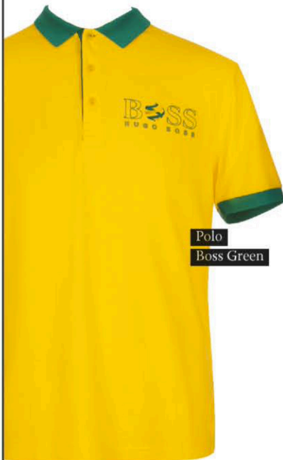
Polo Boss Green