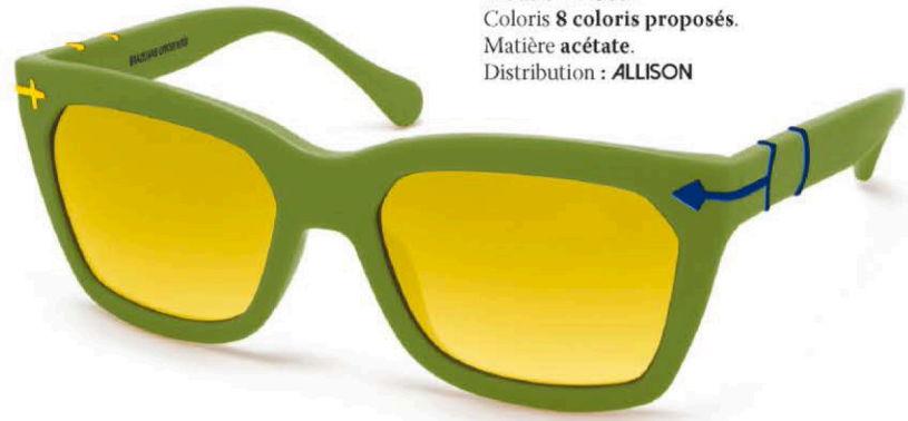
OPPOSIT Modèle TM503. Coloris 8 coloris proposés. Matière acétate. Distribution : ALLISON